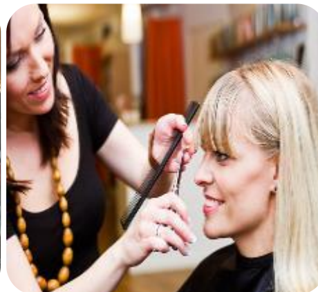
Frizerie & hairstyling